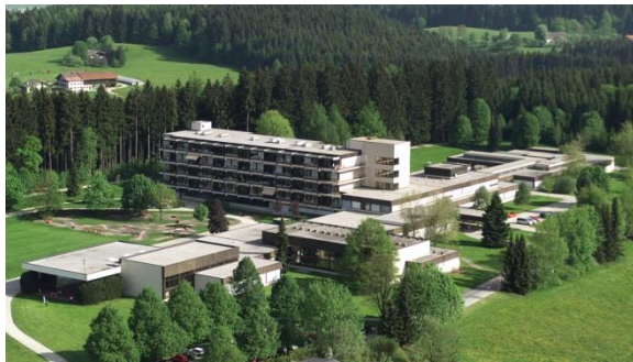
Rehabilitationszentrum Bad Häring