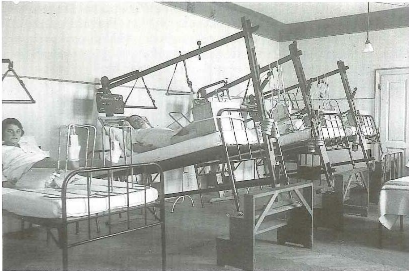
▫ Oberschenkelextensionszimmer in der Webergasse