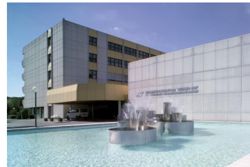
Rehabilitationszentrum Weißer Hof