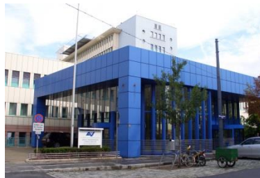
UKH Lorenz Böhler