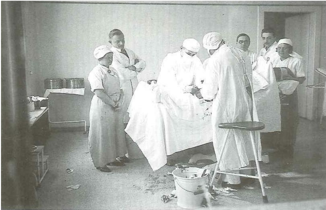
Operation in der Webergasse 1933